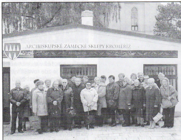
Záběr účastníků letošního zájezdu seniorů do Kroměříže

USH, neckyády, cyklovýlety, stavění máje, nebo rallye „haldových strojů“? Ano, toto vše je spjata se skupinou mladých lidí v 80.letech v Hrabové. Symbolem té doby se stala skupina „JAKOST“, která si svým vystoupením na hřišti TJ SOKOL Hrabová letos v srpnu připomněla 20.výročí svého založení.