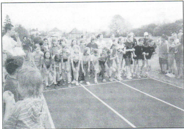
Napětí před startem mladších děvčat v běhu na 500 metrů, kde se sešlo kolem 30-ti závodnic. Záběr je z Ostravského běžeckého poháru na sportovišti ZŠ Hrabová (29.4.2003)