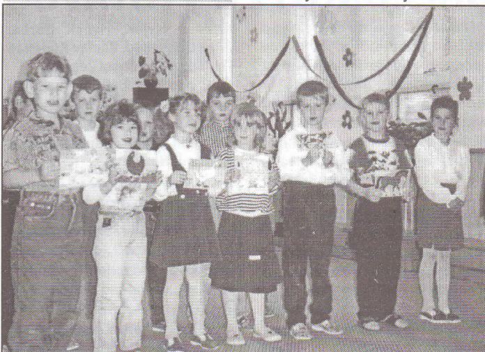
Padesát dětí nastoupilo letos do první třídy základní školy na Paskovské ulici. Byly mezi nimi i ty, které chodily do mateřských škol v Hrabové. Před prázdninami se s MŠ rozloučily společnou besídkou, kde svým rodičům předvedly co se vše naučily, a že jsou na první třídu připraveny. Mateřskou školu ukončilo 17 dětí ul.V.Huga a 25 dětí z ul. Příbořské.

paní Martina Křilová chce provozovat na Šrobárově ulici č. 22 mandlovnu? Jejich služeb můžete využít po zahájení provozu dne 4. 10. 1999.