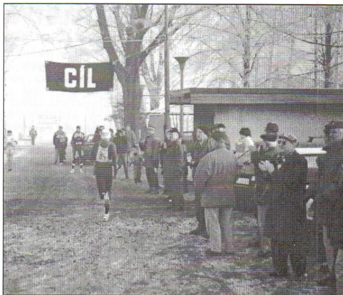
Jubilejní silvestrovský běh Hrabovou byl dobře připraven a borce v cíli na hřišti místní TJ SOKOL sledovalo, přes nepřízeň počasí, hodně příslušníků.