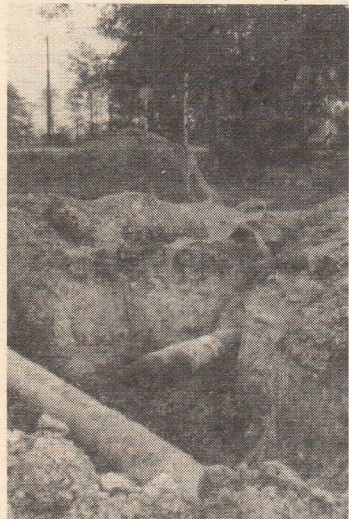
Dočasné krátkodobé omezení přinesly letos občanům v pěší zóně výkopové práce pro plynofikaci.

Ve II. díle jsou zachyceny události v období 2. světové války a po válce. V Hrabovských listech se vám pokusíme přiblížit minulost obce a jejích obyvatel,