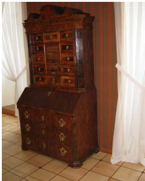
▲ Beethovenova skříň