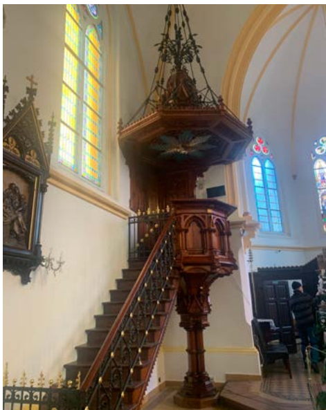
▲ Restaurovaná kazatelna z kostela sv. rantiška a Viktora v Ostravě-Hrušové