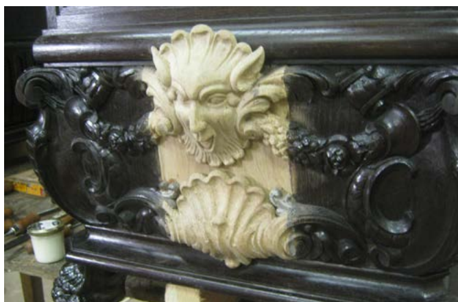
▲ Řezané detaily maskaronů na starožitném psacím stole z Muzea Těšínska

Takových zakázek je více, ale některé mi v paměti zůstaly opravdu výrazně. Nejčastěji vzpomínám na anglickou skříň ze zámku v Hradci nad Moravicí, která mě naprosto uchvátila. Pocházela z 18. století a je fascinující, že tehdy nešlo jen o užitkový předmět, ale také o symbol prestiže a společenského postavení.