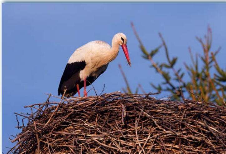
▲ 21. 3. Čáp Vilém se vrátil domů. Letos dorazil nejdříve za posledních sedm let a hned se pustil do úprav hnízda.