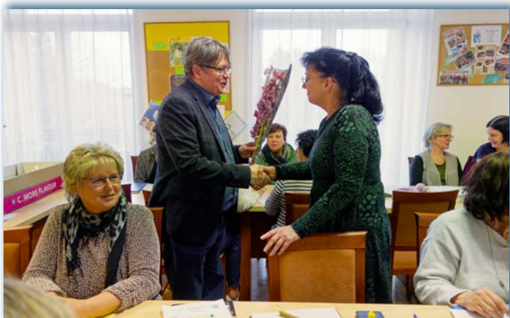
▲ 31. 3. U příležitosti Dne učitelů děkujeme pedagogům naší základní školy za jejich každodenní práci. Poděkování patří i všem dalším pracovníkům školy, kteří se podílejí na jejím chodu.