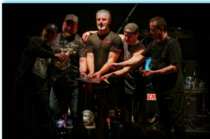
▲ 28. 3. Křest nového CD kapely Prokerr byl součástí rockového večera v kulturním domě. Kapely to rozjely už od šesti večer a atmosféra se postupně stupňovala. Na pódiu se vystřídaly A šmytec, Jakost, Prokerr a Exitus.