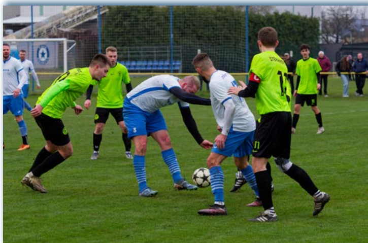
▲ 28. 3. Druhé utkání jarního kola mezi TJ Sokol Hrabová a TJ Sokol Štěpánkovice skončilo remízou 2:2. Domáci šli do vedení z penalty, krátce před koncem opět získali vedení, ale v nastaveném čase hosté vyrovnali a zajistili si bod.