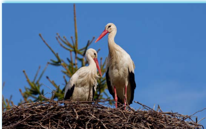
▲ 4. 4. Po dlouhých čtrnácti dnech čekání se náš čáp Vilém konečně dočkal – jeho partnerka Jasmína se vrátila zpět na hnízdo. Teď už nezbývá než držet palce, aby se jim dařilo a brzy jsme se mohli těšit i na malé přírůstky.